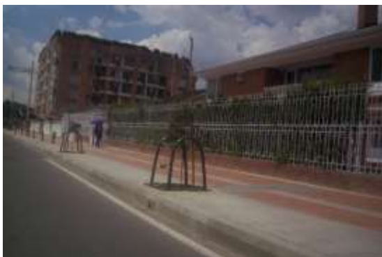
Imagen 4. Andenes calle 127

Se encuentran en ejecución el tramo de andenes entre carreras 9 y 15, costado norte.