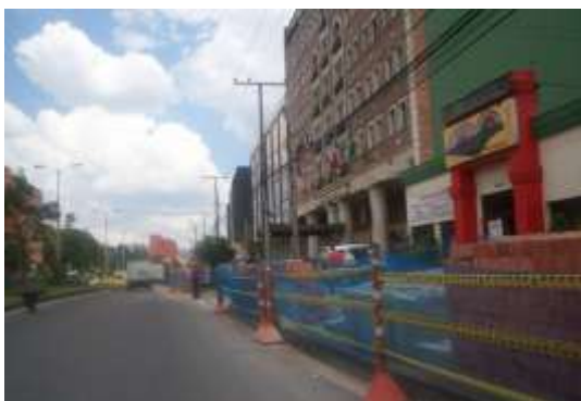
Imagen 3. Andenes carrera 15

A enero de 2011, la construcción de los andenes de la carrera 15 entre calles 100 y 127 presenta un avance de 77%. El IDU estima que estas obras terminarán en el mes de abril de 2011, es decir, 5 meses después de la fecha prevista en el contrato.