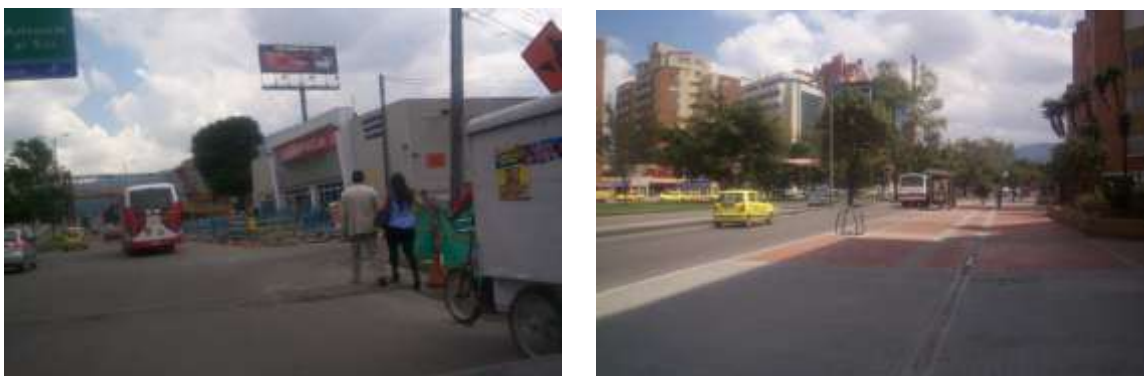
Imagen 2. Andenes carrera 68-calle100