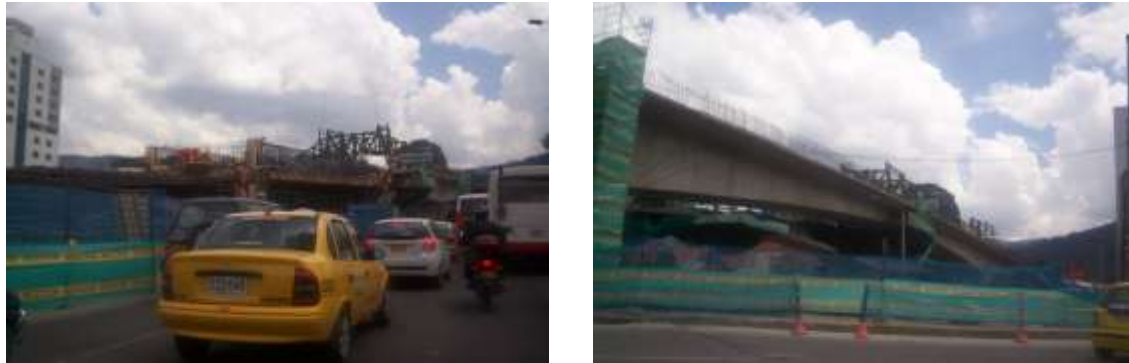
Visita técnica