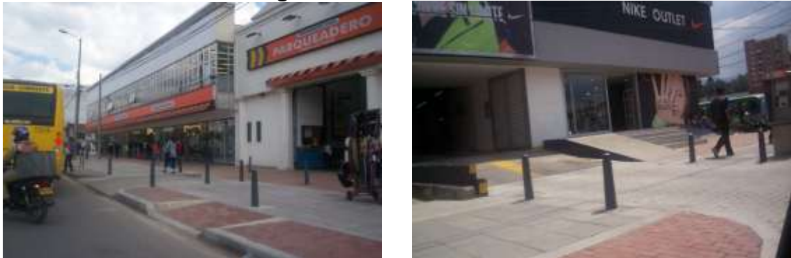
Imagen 1. Andenes avenida 19

Se encuentra en ejecución el tramo de andenes comprendido entre las calles 144 a 152. Se destaca que ya se terminaron las obras frente a la CCB Sede Cedritos.