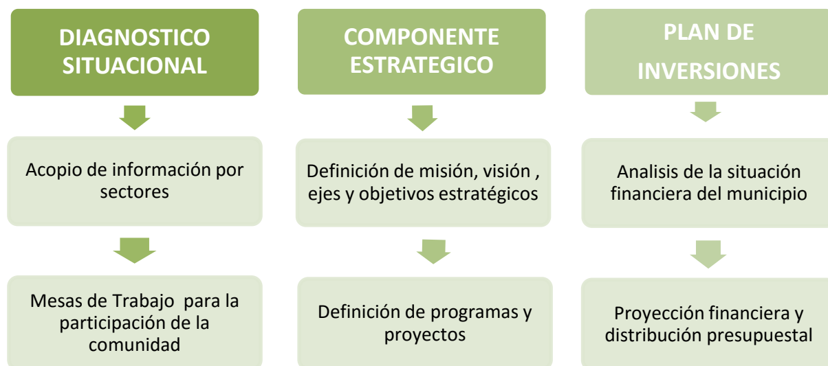
Figura 1. Propuesta Metodológica

Cada una de estas fases se describen a continuación.