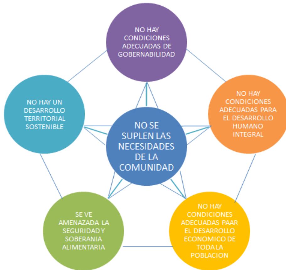
Figura 8. Diagrama análisis de seguridad territorial del municipio de La Calera (Elaboración propia, a partir de Wilches 2007)

No hay condiciones suficientes para el desarrollo económico de toda la población. No se garantiza a todas y todos, el acceso a bienes y servicios, ni a la generación de ingresos para la población que no controla los medios de producción, por lo tanto, no se dan condiciones de productividad y competitividad y tampoco se garantiza la seguridad económica.