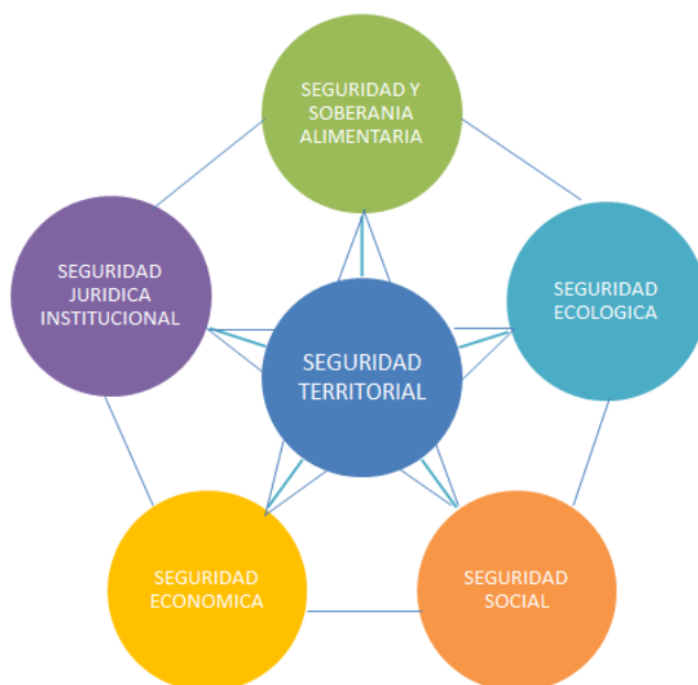
Figura 3. Diagrama Seguridad Territorial (Modificado de Wilches – Chau. 2007)

Se entiende como seguridad alimentaria: “La capacidad que tiene un territorio para garantizarle a sus habitantes los alimentos básicos que requieren para disfrutar del derecho a la vida con calidad y