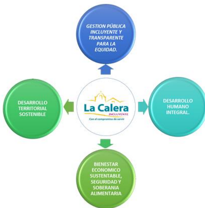
Figura 11. Diagrama análisis de seguridad territorial del municipio de La Calera (Elaboración propia a partir de Wilches, 2007)