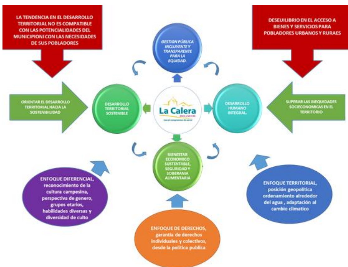
Figura 9. Estructura PDM “La Calera Inuyente con el Compromiso de Servir”