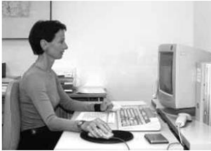
Figure 47 Hauteur idéale d'un écran classique.

NOTA: Para el caso de los puestos de los Cajeros, es indispensable que el plano de trabajo para impresora y escáner esté por debajo de 15 a 20 cm del plano de trabajo principal o del computador para evitar que los movimientos de brazo del colaborador sobrepasen la altura del hombro igualmente tener en cuenta esta recomendación para la altura del mesón de atención al público.